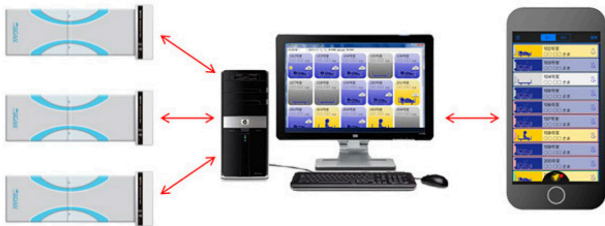
リアルタイムモニター